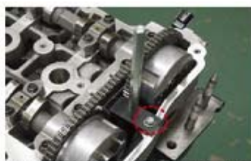
ヘッドのボルト穴に共締めし、固定します。

チェーンテンショナーのロックを解除した状態でタイミングチェーンケースASSY内側から、チェーンのテンションサイド側に沿わせてTCTリリースバーを挿入目安ラインとタイミングチェーンケースASSY上面が揃うところまで差し込む。